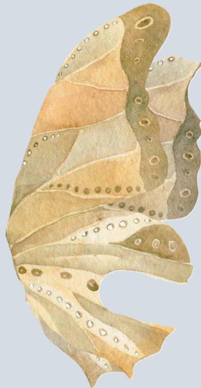
Papillon de sable fragmenté

Notez qu'il peut contenir des zones de transparence.